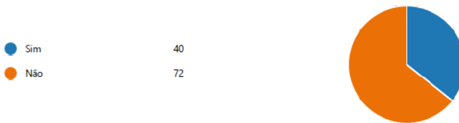
Gráfico 1 – Respostas à questão “usou algum recurso partilhado, por outro colega, no Banco de REDs?”

Foi perguntado aos docentes se usaram algum recurso partilhado nestas pastas.